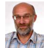
Gerbert Oosterlaken Beers Varkenshouderij