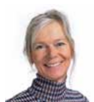
Rianne Bens Haps Pluimveehouderij